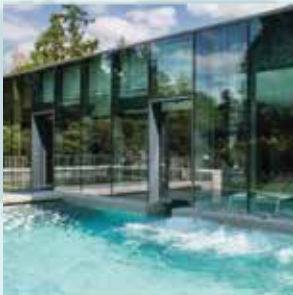
SPAS EM HOTÉIS