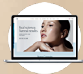
LOJAS FLAGSHIP ONLINE