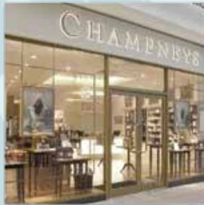
DAY SPAS E INSTITUTOS DE LUXO