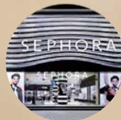
REVENDEDORES DE PRESTÍGIO