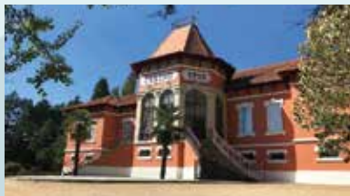
PEDRAS SALGADAS SPA & NATURE PARK PEDRAS SALGADAS