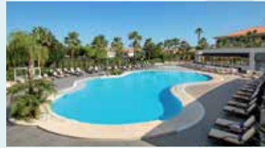
WYNDHAM GRAND ALGARVE QUINTA DO LAGO