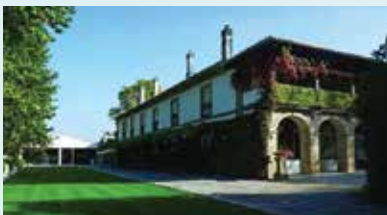
THE WINE HOUSEHOTEL - QUINTA DA PACHECA LAMEGO