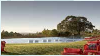
PRAIA DO CANAL NATURE RESORT ALIEZUR