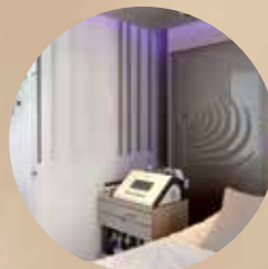
THE HOUSE OF ELEMIS