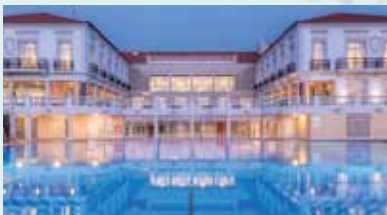
PRAIA D'EL REY MARRIOTT GOLF & BEACH RESORT ÓBIDOS