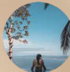
DESTINOS DE VIAGEM AÉREOS & MARÍTIMOS