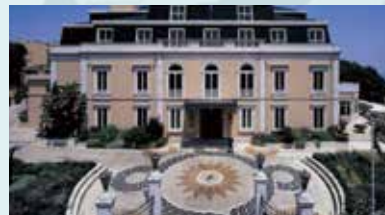
OLISSIPPO LAPA PALACE HOTEL LISBOA